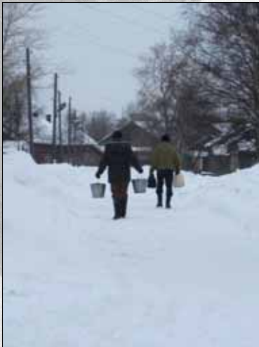
Ajassa sata vuotta taaksepäin vai olisiko peräti Jeesuksen aikaan - "...minun ikeeni on sovelias"

Kotikäynneillä maailma taas avartui. Monenlaisten elämänhistorioiden äärellä olin vahvasti oppimassa, mikä on tärkeintä tässä elämässä ikuisuutta varten. Olosuhteiden voivottelua ei kuulunut. - Ehkäpä siitä syystä, että on jatkuva lama meidän mittapuulla mitattuna, parempaa ei osata edes kaivata. Elämä menee muutenkin... Tärkeää oli ihmisille, että he saivat kertoa elämän tarinaansa. Tärkeää oli myös, että asioita vietiin Taivaan Isälle ja oltiin Sanan ja virsien äärellä. Yhteinen hetki Jumalan Sanan ja sävelten ääressä tuo aina taivaan lähelle!