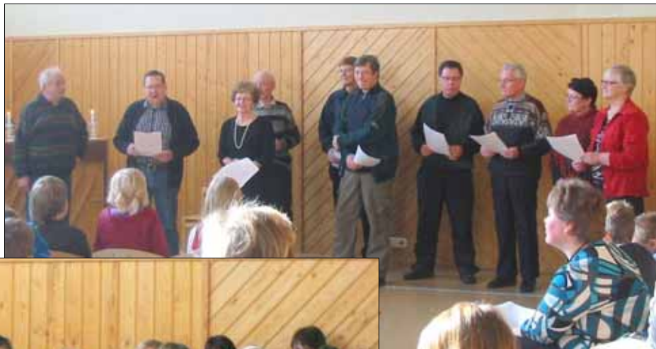
Isovanhemmat ja eläkeläiset laulavat lapsille.