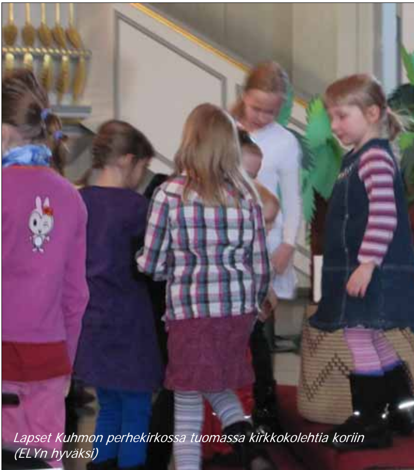
Lapset Kuhmon perhekirkossa tuomassa kirkkokolehtia koriin (ELYn hyväksi)