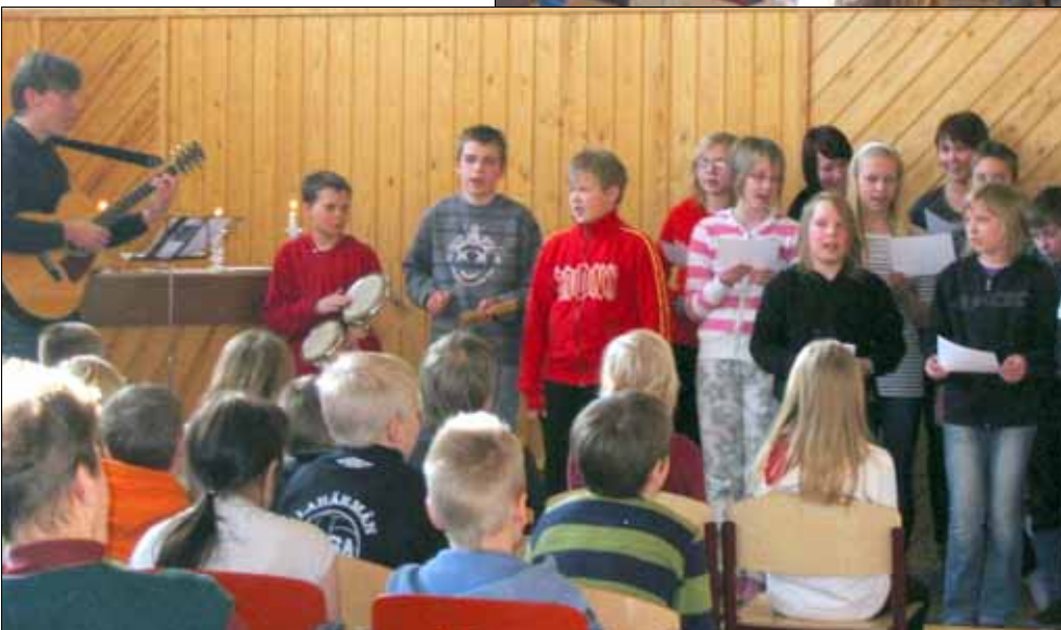
Lapset laulavat omia harjoittelemaansa hengellisiä lauluja.