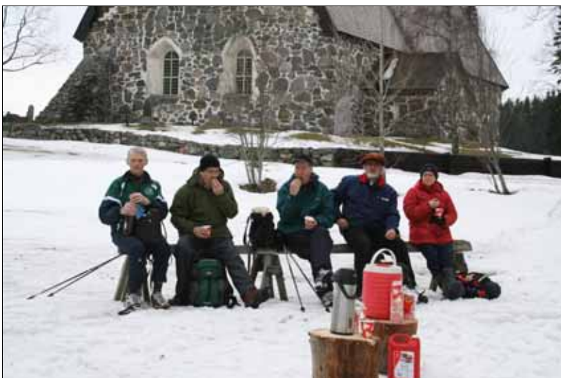
Vaellusryhmä Sastamalan kirkolla syömässä evästä.

Sastamalan keskiaikainen kirkko oli vaelluksen puolivälissä. Pyhän Marian kirkon muurit ovat nähneet monta pitkäperjantaita. Ne ovat suojanneet kirkkokansaa vuosisatojen ajan. Sanaa on julistettu. Evankeliumin voiman