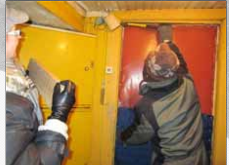
Rivitalo-ohoneistoon pyrkimässä, taisi olla kesäasumista varten.