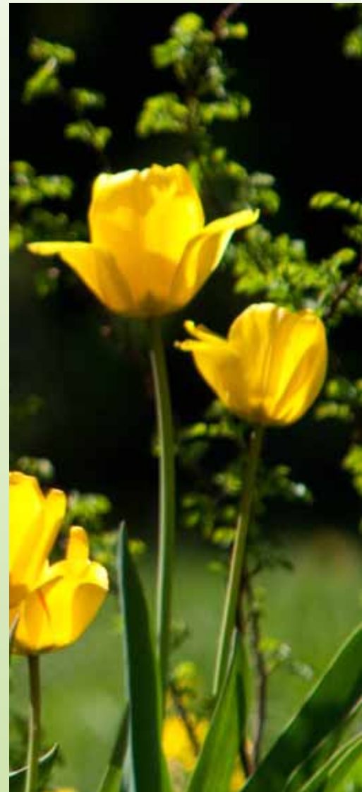
Kansikuvat Urpo Vuorenoja