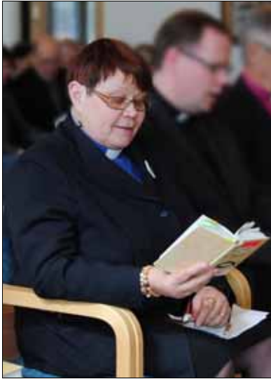
Kuva Timo Keski-Antila