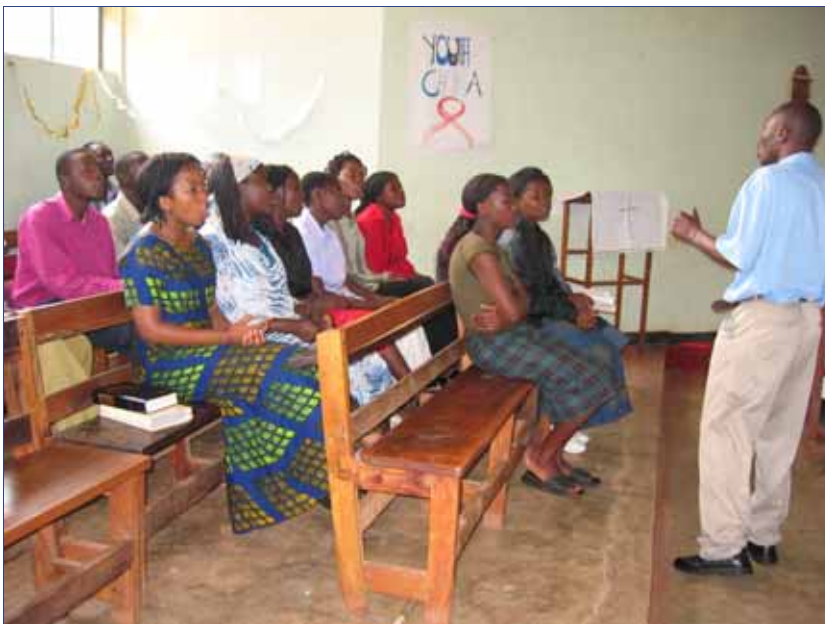
Nuorten kuoro valmistautuu esiintymään Malawissa.

Kirkolla on jatkuva tarve saada uusia työntekijöitä. ELY on antanut tukea ensin kyläkirkko-