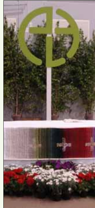
^ Tulevilla kesäjuhlilla nähdään Hyvinkään juhlille valmistettu ELYn logopylväs. Tunnus lähtee seuraavan vuoden juhla järjestäjän mukaan juhlien päättyessä.