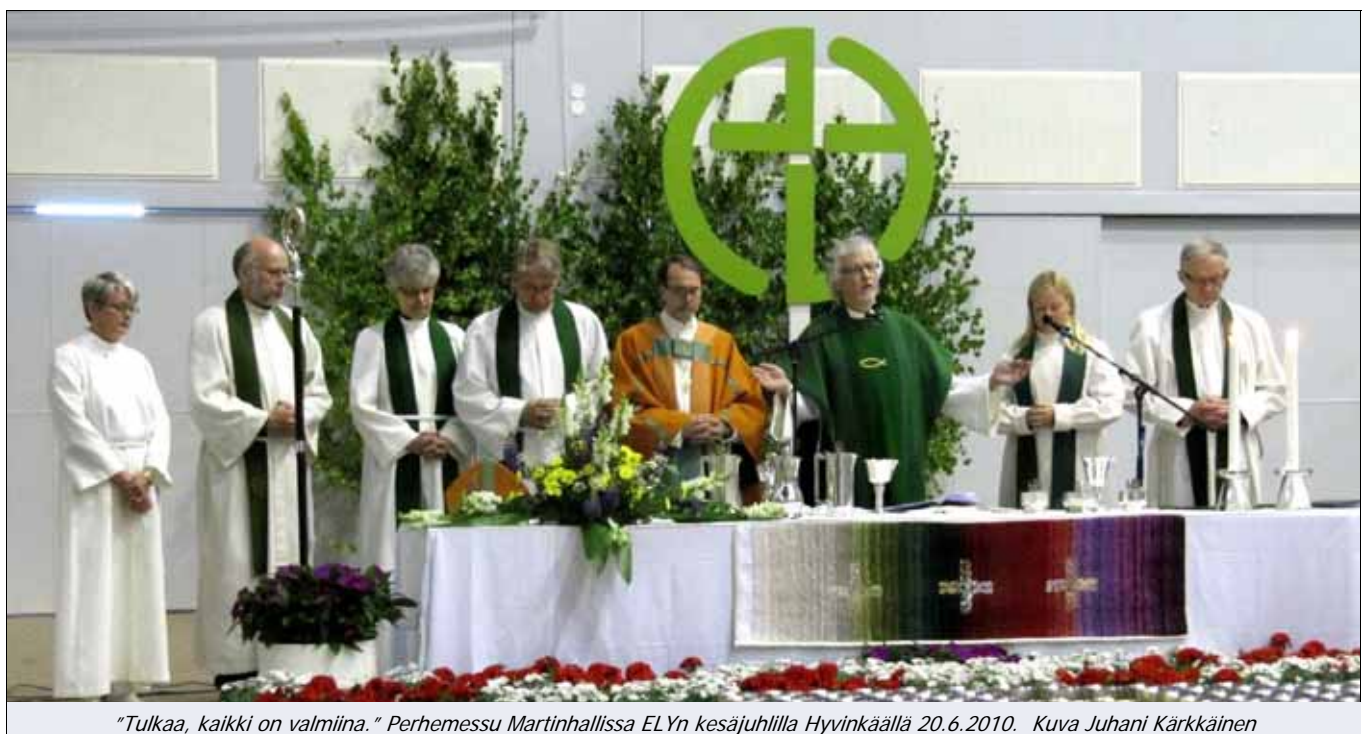
"Tulkaa, kaikki on valmiina." Perhemessu Martinhallissa ELYn kesäjuhlilla Hyvinkäällä 20.6.2010.

Matkalla autuuteen muistamme, että Jumalan "sana on jalkaini lamppu ja valkeus minun tielläni", Ps.119:105. Muistamme, että uskon tie on myös rakkauden ja palvelun tie. Apostoli sanoo: "Nyt minä osoitan teille tien, verrattoman tien", "korkiamman" tien, se on rakkaus, 1.Kor.12:31, luku 13. Mutta yksin Jumalan rakkaus on täydellistä rakkautta. Sen varassa lepää elämämme, ihmissuhteemme ja pelastuksemme.