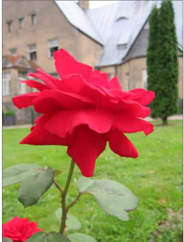
Tageperän linna.

Sydämellinen kiitos kaikille mukana olleille. Teitte tämän ELYn ensimmäisen ryhmämatkamme kukin osaltanne mahdolliseksi, samalla kun rikastutitte muutenkin yhteistä matkaamme lauluin, rukouksin ja matkahartauksien avulla. Sydämin, suin ja käten töin olitte mukana matkalla, jonka muistoja voimme nyt koota ja rukoilla kohtaamiemme ihmisten puolesta jatkossakin. Kiitollisena tervehdin myös Elysanomien lukijoita Tageperän linnan ruusulla. Samalla toivotan Jumalan runsasta siunausta kohta vaihtuvaan syksyynne.