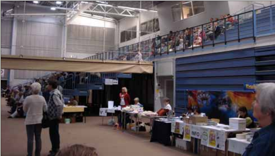
< ELYn info-pöydän vieruksilla oli tarjolla mm. arpoja, käsitoita, kirjallisuutta, koulutustietoa. Taustalla juhlaväkeä seuraamassa Laulun juhlaa Martin-hallissa. Info-/myyntipöydät olivat sijoitettu juhlan kanssa samaan tilaan.