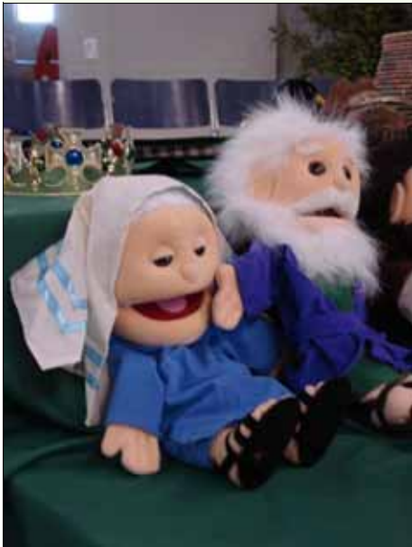
Raii ja kolme apostolia.