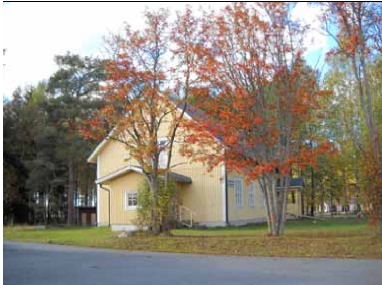
Purmojärven rukoushuone.

sesti korostaa, mutta siihen aikaan usko näkyi ja kuului. Ajoittain myllärinäkin toiminut kummisetäni risti myllykamarissaan jauhoiset sormensa ja kumartui rukoukseen ennen eväsvakkansa avaamista. Asiakkaat ja muutkin iltaa viettämään tulleet hiljenivät siksi aikaa, sitten arkinen juttu taas jatkui. Mylly toimi siihen aikaan myös kylän sähkölaitoksena, jonka generaattori iltamyöhällä valomerkin jälkeen pysäytettiin. Siksi siellä viivytettiin pitkään. Joskus siellä käytiin myös vakavia "myllykamarikeskusteluja". Sellaisina iltoina valomerkki viivästy. Kyläläiset tiesivät: -Taas siellä puhutaan niistä uskonasioista!