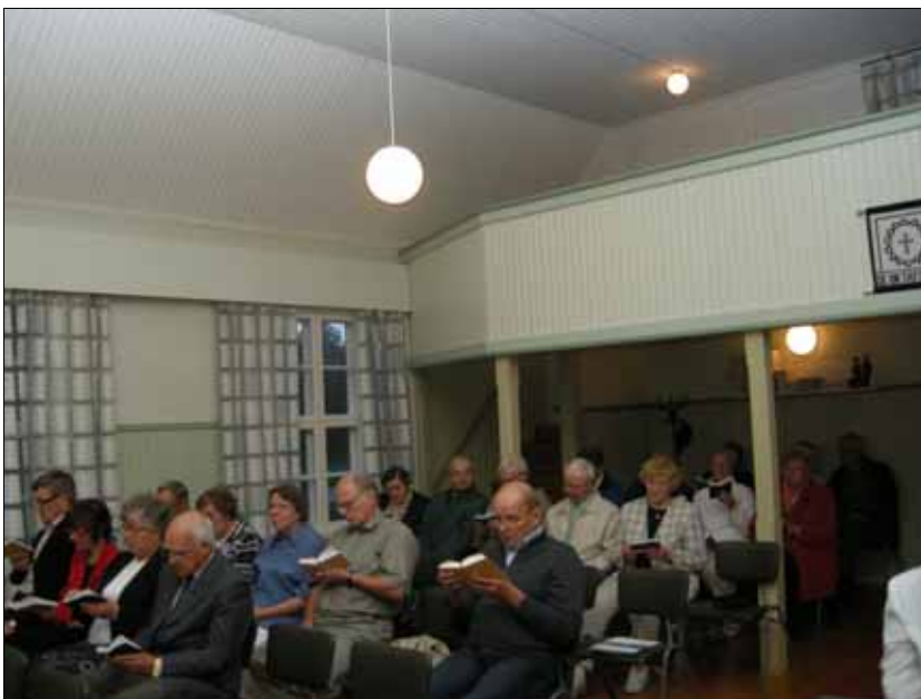
Siionin Kannel-seuroissa Purmojärven rukoushuoneessa.

Syntynyttä herätysliikettä tukivat myös evankeliset maallikkosaarnaajat. Vanhat muistelivat, että isäni syntymäkodin Nevantauksen talonväen puidessa istuskeli lämpimän riihen oven kamanalla saarnamies ja lauloi väelle Siionin kanteleen lauluja illan seuroja odotellessaan.