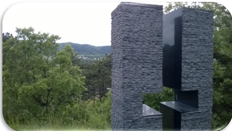
Ristin tie kylässämme Perchtoldsdorfissa