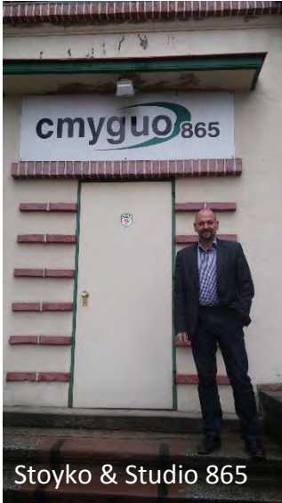
Stoyko & Studio 865