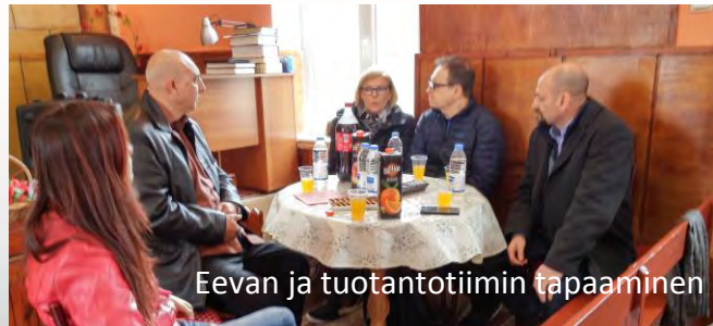
Eevan ja tuotantotiimin tapaaminen