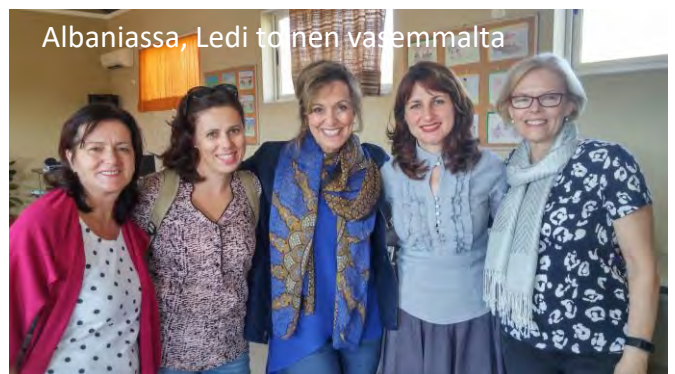
Albaniassa, Ledi toinen vasemmalta