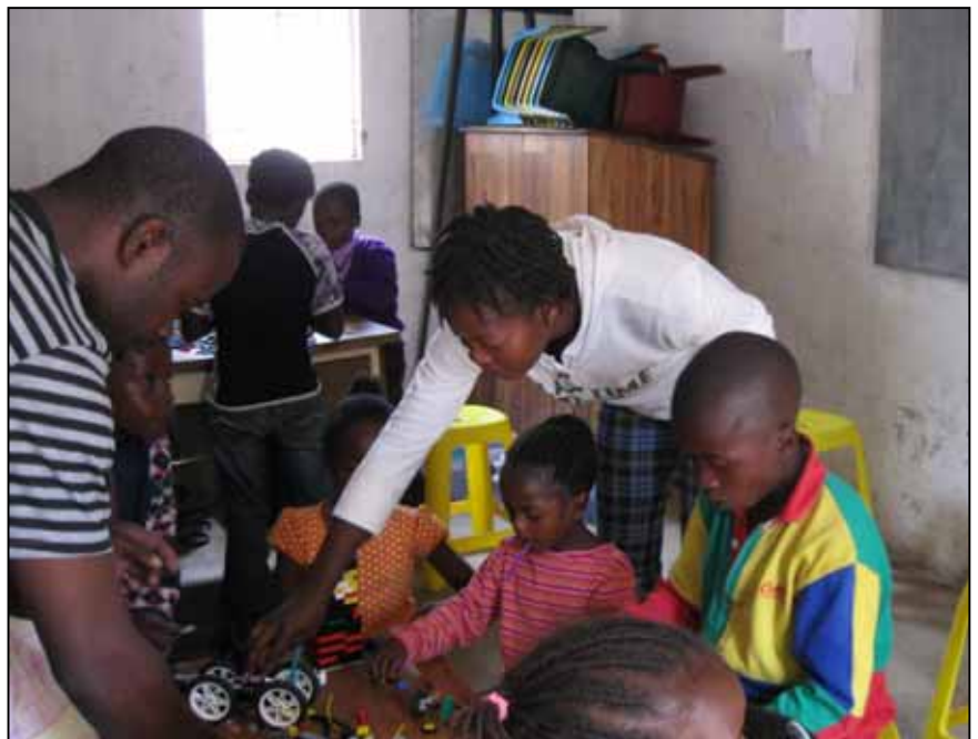
Kuva TEDITE-koulusta Sambiasta

ELY tekee itsenäistä lähetystyötä Venäjällä yhteistyössä Inkerin kirkon kanssa sekä Sambiassa LECA-kirkon kanssa. Neuvottelut ovat meneillään yhteistyön aloittamisesta Viron ev.lut. kirkon kanssa. Lisäksi tuemme Suomen Lähetysseuran ja Medialähetys Sanansaattajien kautta kirkon virallista lähetystyötä erikseen sovitussa kohteissa.