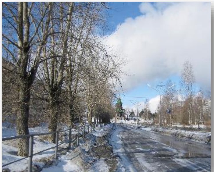
Segesan kaupunkinäkö Bulvar Sovetov valtakadulta.

Vähitellen Venäjän federaatiossa kuitenkin rukattiin ja täsmennettiin lakeja, uniformuja, teitä jne. - Miliisistä tuli poliisi. KGP:stä oli jo aiemmin tullut FSB ja kauppojen hyllyt täyttyivät vuodelta yhä monipuolisimmista "produkteista". Ei tarvinnut, eikä saanutkaan tuoda "humanitääriä" kohtuuttoman paljon. Ihmiset myös alkoivat muistella neuvosto-aikaa, että "oli se sellainen aika, jotta..." Luottamus oli molemmin puolelta. Tulli "rullasi ja rabotti" omassa aikataulussaan. Kaikki meni "normaalna" eli normaalisti. Emme syyllistyneet rikoksiin, emme ainakaan tietoisesti. Emmekä olisi halunneet tehdä niin jatkossakaan.