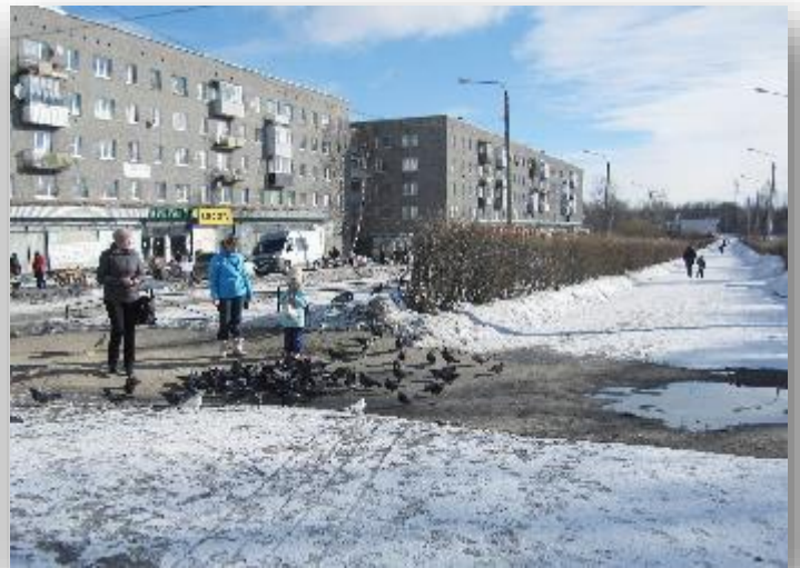
Karjalassa ruokittiin FSB:n kourissa nälkiintyneet, syntäreillä oli "pirokki" ja muut herkut. Segesassa kaupunkipulutkin saivat riittävästi murusia.