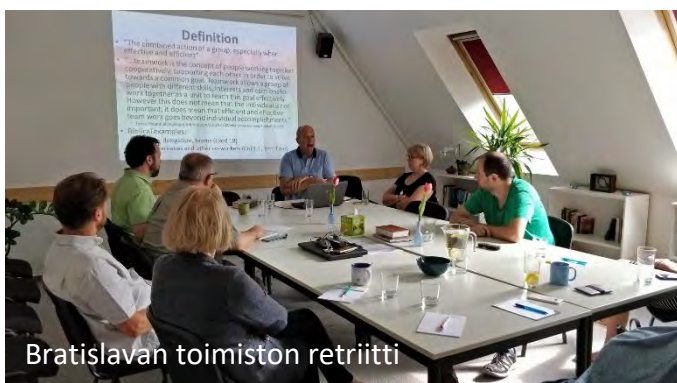
Bratislavan toimiston retiriitti

Tämä konsepti mahdollisesti otetaan käyttöön muillakin alueilla, esimerkiksi Afrikassa ja Aasiassa.