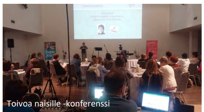
Toivoa naisille -konferenssi