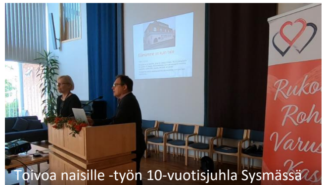
Toivoa naisille -työn 10-vuotisjuhla Sysmässä