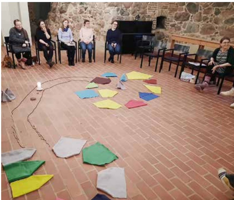
Lattiakuvakoulutus Tarton Paavalin kirkon kryptassa.

Kirkkohallituksen tasolla lapsityöhön ei voimavaroja uhrata, joten yhdistyksemme on tässä avainasemassa. Tärkeää on viedä koulutukset lähelle ihmisiä, rovastikuntiin, jotta mahdollisimman moni voisi osallistua. Koulutuksissa on aina kolme tärkeää osaa: Raamattuopetus, keskustelu työn haasteista ja iloista ja toisten puolesta rukoileminen sekä jokin menetelmä tai työtapo, jota voi käyttää omassa työssään. Näin vahvistamme lapsityöntekijöiden osaamista, keskinäistä yhteyttä ja työmotivaatiota sekä annamme kokemuksen siitä, että he ja heidän työnsä on tärkeää ja merkityksellistä.